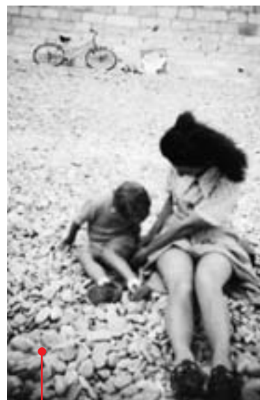
1936, premières vacances : sur les galets, la plage.

Tous les agents des trois fonctions publiques, les personnes à la retraite dont la mutuelle propose des chèques vacances peuvent s'adresser à l'Agence nationale des chèques vacances (ANCV). ■