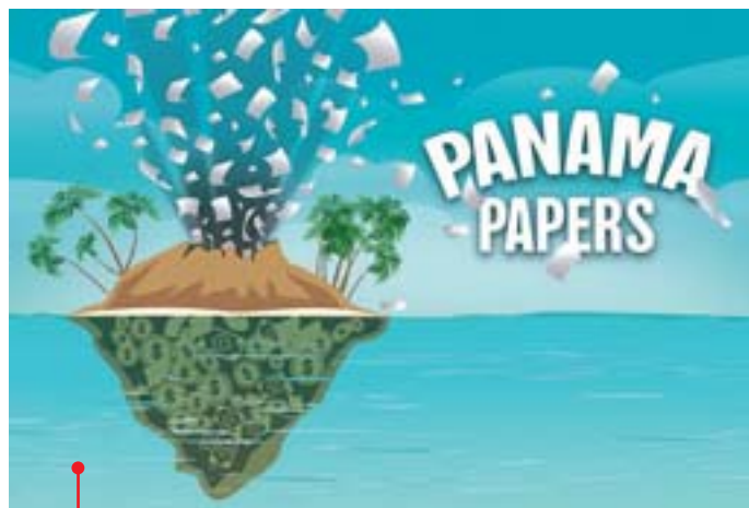
Évasion fiscale : un gisement de richesses à exploiter !

La protection sociale couvre un large périmètre. Ces dernières années,