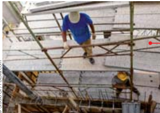
Des travailleurs détachés de plus en plus nombreux dans le BTP.

Autre front : les deux millions de travailleurs détachés travaillant dans l'Union européenne hors de leur pays d'origine, dont 400 000 en France. En principe, ces salariés bénéficient des règles de base du droit du travail, mais pas toutes (par exemple les cotisations sociales sont celles du pays d'origine). Surtout l'utilisation frauduleuse de ces salariés et le non-respect des règles légales sont très répandus, engendrant un dumping social et une exploitation épouvantable de ces sala-