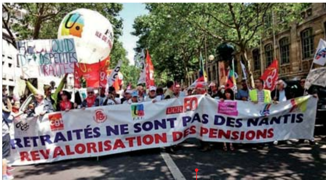
Retraités dans la rue : contre la loi travail mais aussi comme le 9 juin pour leurs propres revendications.