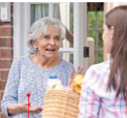
Quel droit au répit pour les aidants ?