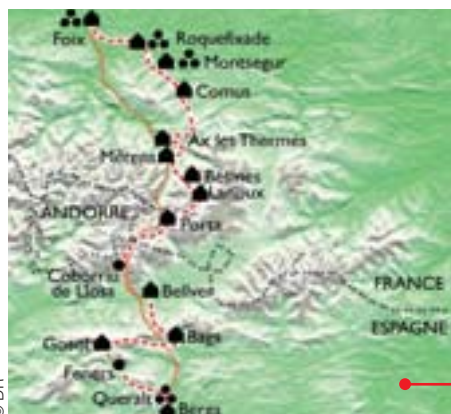
Sur les traces des derniers Cathares.

Topo guide GR 107 dans la plupart des librairies : description du chemin, documentation, indications pratiques (transports, refuges/hôtels, ravitaillement...) ou sur le site www.cdrp09.com (rubrique randonnées). Voir aussi www.gr-infos.com/gr107.htm et www.ffrandonnee.fr (site de la Fédération française de randonnée). Meilleure saison : juin à septembre... compter huit à dix jours de marche pour la totalité du parcours.