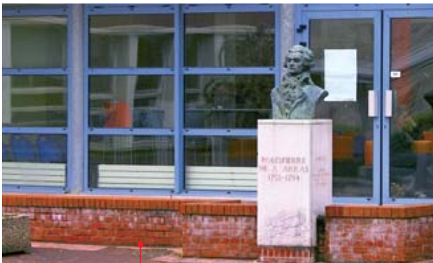
Le buste de « Robespierre » dans le lycée d'Arras qui porte son nom.

Depuis deux siècles et demi, il est présenté comme la « légende noire » de toute révolution émancipatrice des peuples ; il est salutaire de « déconstruire » cette pensée dominante.