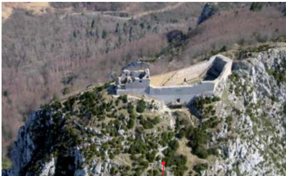
Le château de Montségur, haut lieu de la résistance cathare.

Il faut prendre le temps de savourer les haltes et la première étape, l'incontournable Montségur. Le château, perché sur un piton à 1 200 m d'altitude, se mérite, mais le chemin